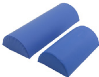
Art.nr: CMPLKM25 (mjuk) Namn: Liten knä kudde 25 Storlek: 25x17cm Höjd: 8 cm