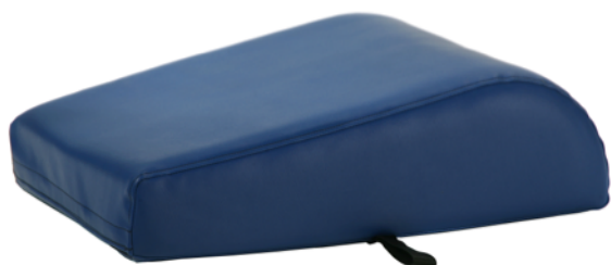
Artikelnr: CMPKKF Namn: Knä kudde Flack Storlek: 55x38 cm Höjd: 16-8 cm